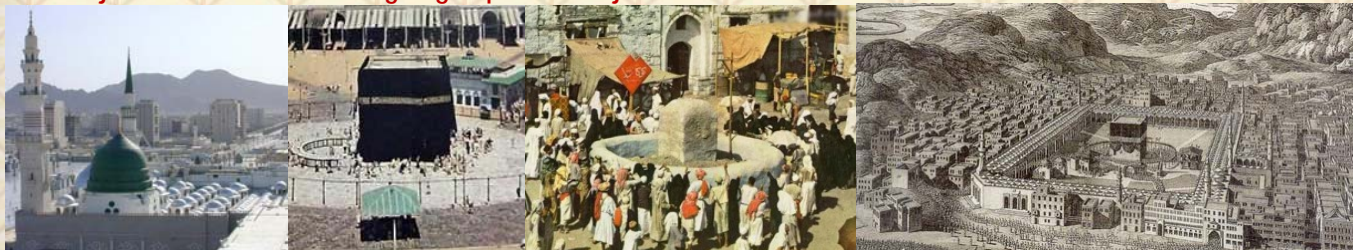
Old pictures of holy Harmain Sheriffain (Makkah and Madina) and Jamrat when small number of pilgrims used to come.

Haj Mubarak to All who are going to perform Haj and Eid Mubarak to rest of the brothers and their families.