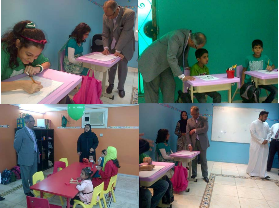
Consul General keenly receiving info about BIL and offering affection to the students of special needs

Where Office Bearers of Memon Welfare Society were also invited.