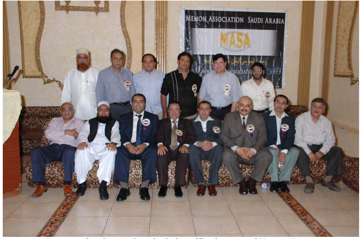
A group of active workers includes office bearers of Memon Jamat

WE BELIEVE THAT THIS EVENT WOULD HAVE PROVIDED THE ATTENDEES WITH A GREAT OPPORTUNITY OF INTRODUCING, SITTING, MEETING, DISCUSSING, LEARNING TOGETHER AS WELL AS ESTABLISHING RELATIONSHIP WITH OTHER MEMBERS OF OUR COMMUNITY.