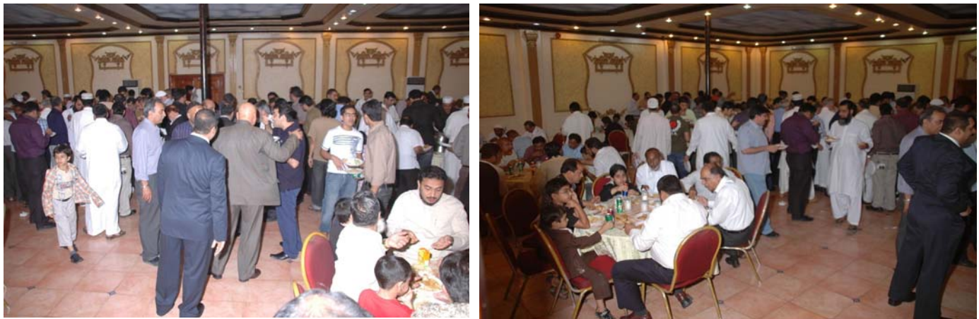
Dinner time after the Seminar